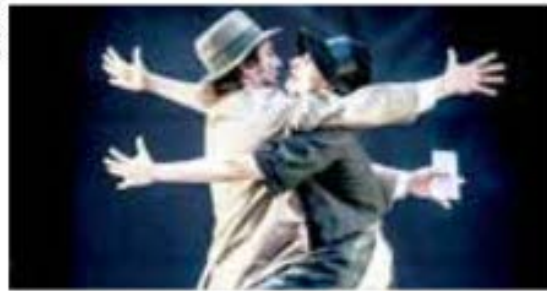
Les Aimants, de la Compagnie M.M.

Entre les possibilités narratives de la danse et l'incarnation poétique du théâtre, Sara Mangano et Pierre-Yves Massip se lancent dans une réflexion en mouvement sur l'amour. À l'International Visual Theatre.